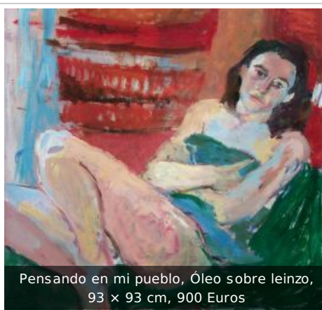
Pensando en mi pueblo, Óleo sobre lienzo, 93 x 93 cm, 900 Euros